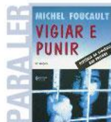
Vigiar e Punir - História da Violência nas Prisões Autor: Michel Foucault Editora Vozes

O conjunto de pesquisas reunidas na publicação Álcool e drogas na história do Brasil oferece um panorama inédito do significado que o álcool e as drogas tiveram na história do País. Por meio desse conjunto de textos, apresenta-se, sob diversos ângulos de estudo e reflexão, uma amplitude de práticas sociais que vão da cura ao crime, da alimentação ao amor, da medicina à religião, da farmácia ao folclore, da biopolítica à geopolítica. A obra procura revelar, ainda, a riqueza de fontes documentais e de problemáticas de pesquisas referentes a um debate que é central para o mundo contemporâneo, conferindo a ele, através da história, necessária e urgente profundidade.